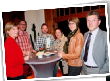
lundi 1 er avril au Mayence et au PBA