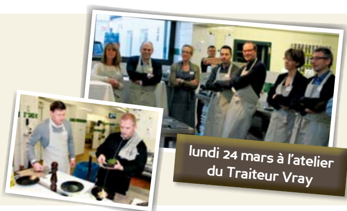
lundi 24 mars à l'atelier du Traiteur Vray

déclinaisons et sans perte ». Les membres ont travaillé le produit en carpaccio, rôti en sauce, et utilisé le corail pour la confection d'un flan tout en partageant leurs impressions autour d'un verre dans une atmosphère très conviviale.