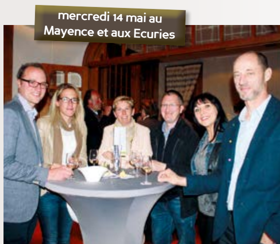
mercredi 14 mai au Mayence et aux Ecuries

Après la soirée spéciale « Mars et Venus 2 », le club B4C renouvelait l'expérience d'une formule « all-in » - apéritif, spectacle, cocktail dînatoire - avec près de septante membres et invités pour assister à la représentation du chef-d'œuvre de Jaco Van Dormael et de son épouse Michèle-Anne De Mey « Kiss & Cry ». Déjà présenté à plus d'une centaine de membres au mois de décembre 2012, cette production de Charleroi Danses à une fois encore marqué les esprits tant l'émotion était encore perceptible à la fin de la représentation.